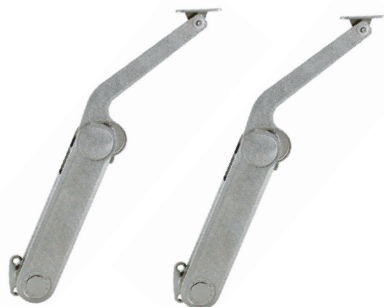
2x Lado derecho, lado izquierdo